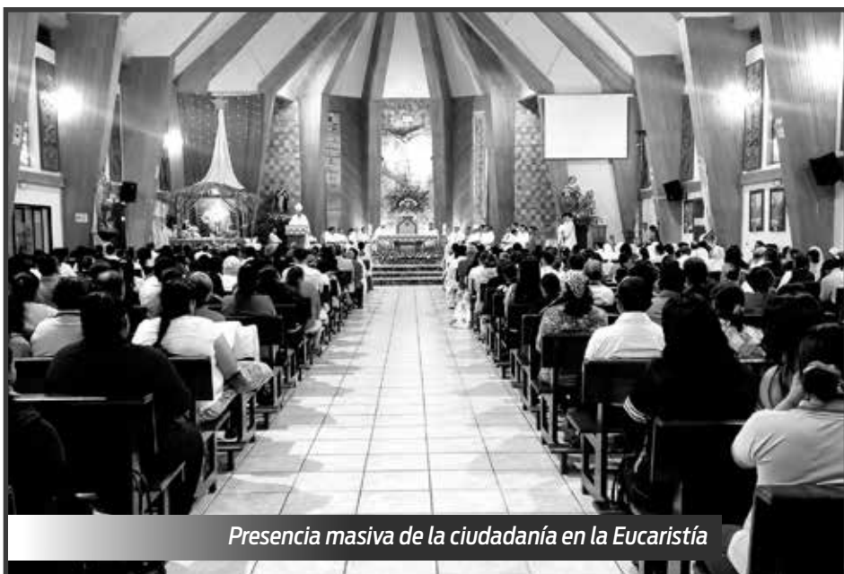
Presencia masiva de la ciudadanía en la Eucaristía