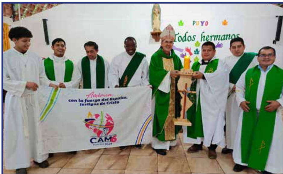
Celebración misionera en Puyo preparando el CAM6 a celebrarse en Puerto Rico en septiembre de 2024.