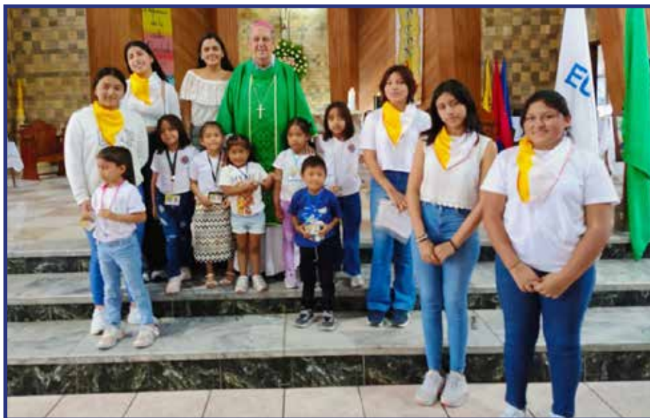
En la catedral de Puyo se realizó, la incorporación de animadores, nuevos miembros de Infancia misionera y de la IAM.