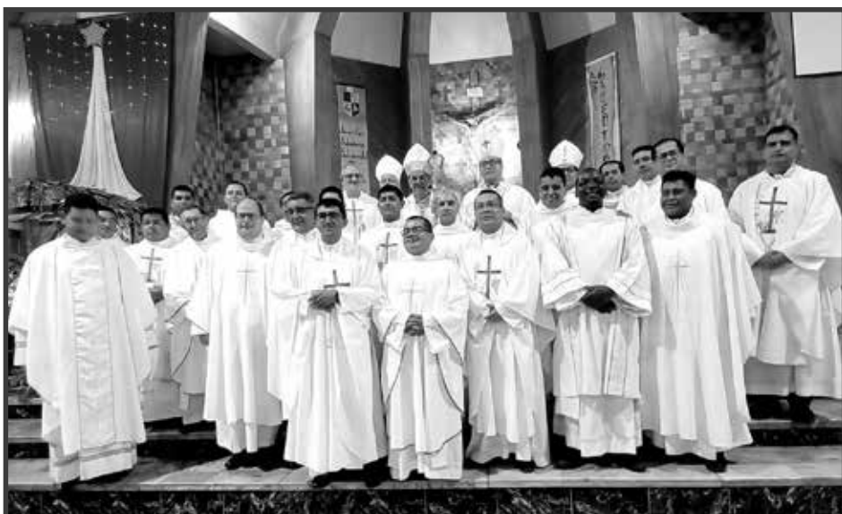
Monseñor junto a los sacerdotes del VAP