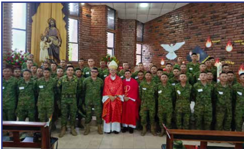
Confirmaciones de 47 conscriptos en la Parroquia de San José de Shell