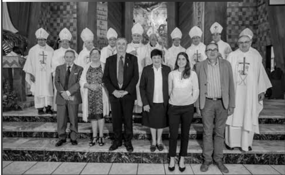
Monseñor junto al Nuncio, Obispos y su familia