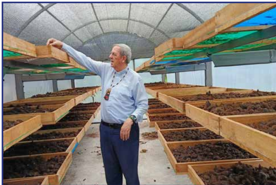
Visita en Canelos, las instalaciones del Centro de Acopio para achiote y el proyecto para las mujeres Uru Warmi.