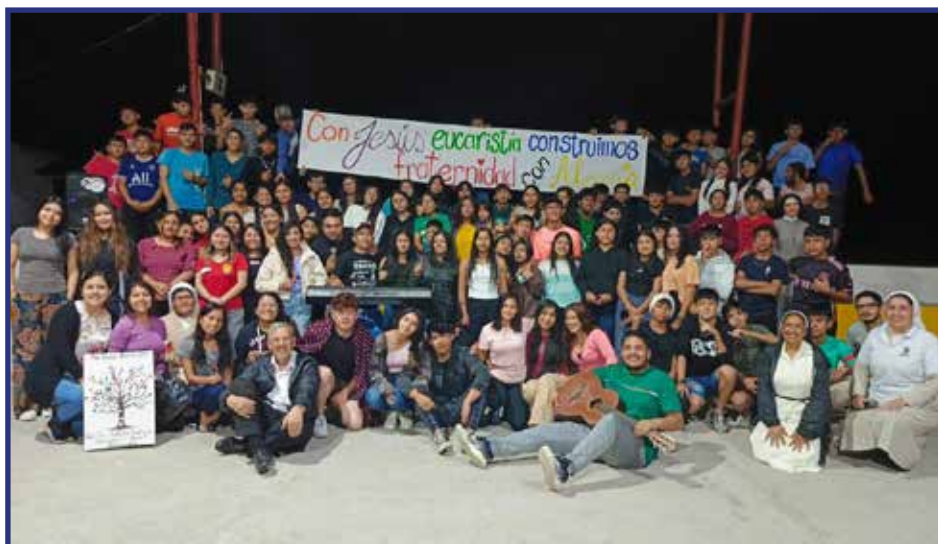
Inicio de la Semana Santa que nos acerque más a la santidad que Dios nos pide; hoy y el mundo necesita. Pre-Pascua Juvenil del Vicariato Apostólico Puyo en Palora con más de 100 participantes..