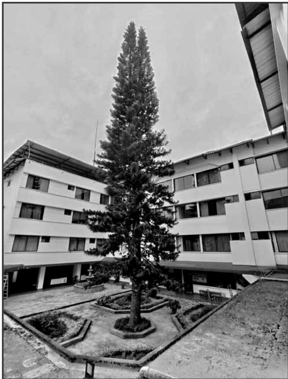
El árbol más alto de la ciudad de Puyo con 44m de altura