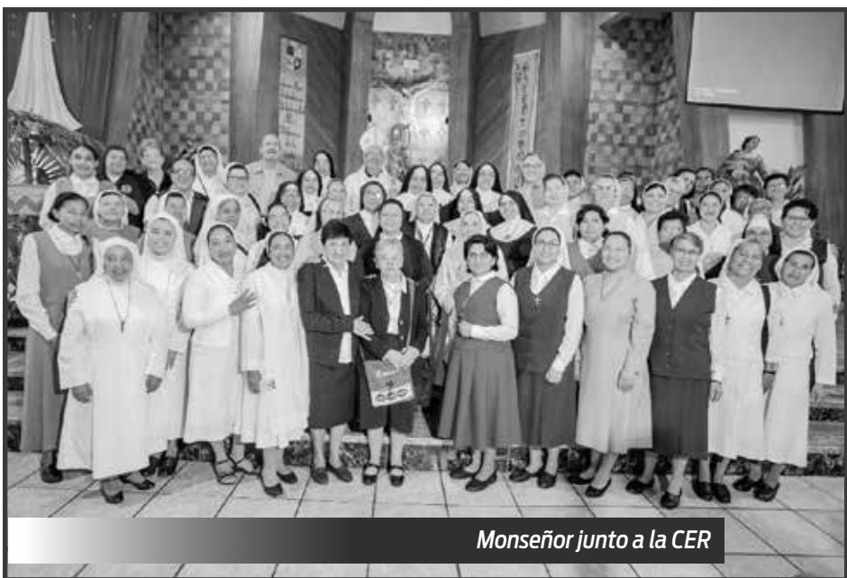
Monseñor junto a la CER