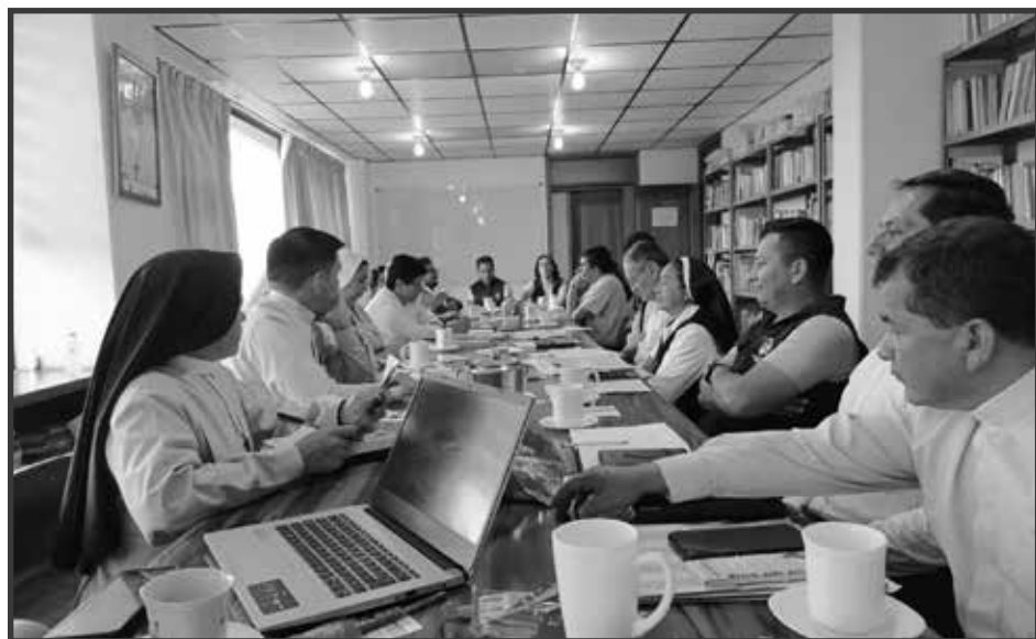
Primera reunión anual del Consejo Pastoral del Vicariato Apostólico de Puyo.