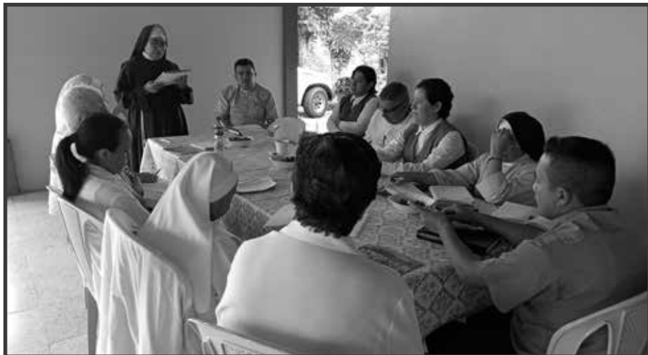
Los misioneros de las zonas pastorales tienen sus reuniones de medio año para evaluar el camino recorrido y programar los meses venideros.