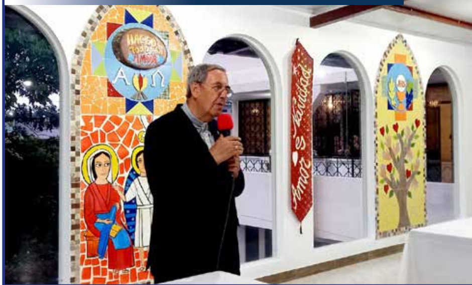
Monseñor en sus 25 años de vida episcopal