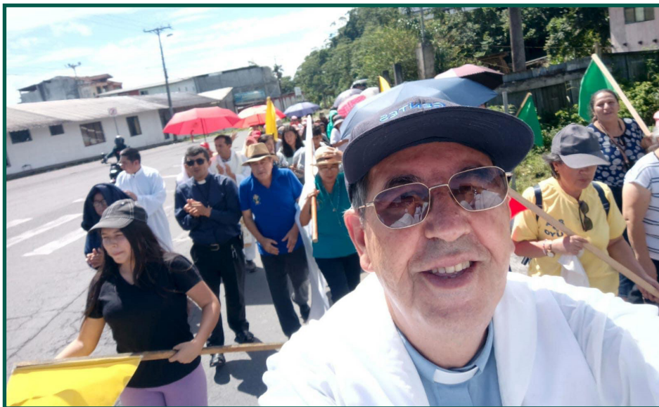
Misión cumplida desde Puyo peregrinación misionera al santuario de la Purísima de Macas.