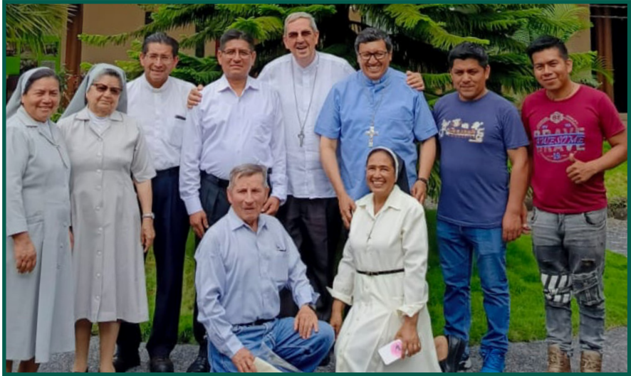
Encuentro Nacional de Agentes de Pastoral Indigena