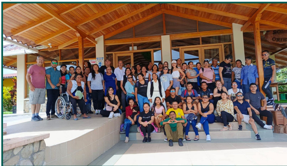
Día de integración con los trabajadores del Vicariato Apostólico PUYO.