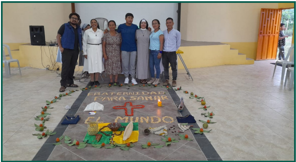
Encuentro Nacional de Agentes de Pastoral Indigena